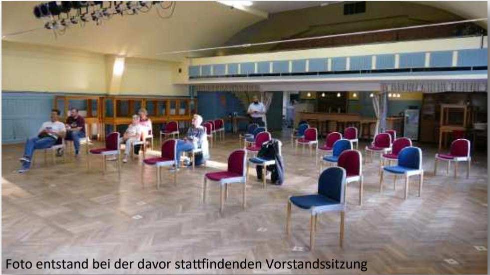
Foto entstand bei der davor stattfindenden Vorstandssitzung